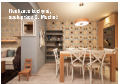
Realizace kuchyně, spolupráce D. Machač