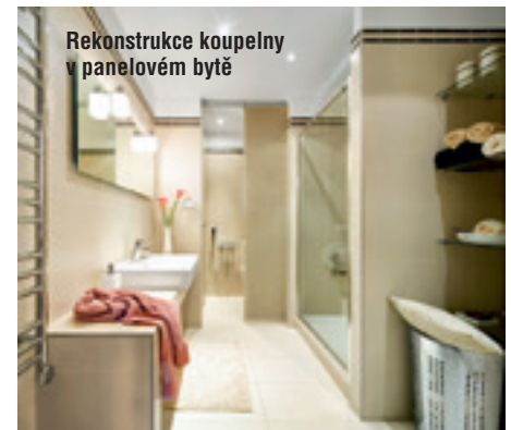
Rekonstrukce koupelny v panelovém bytě

Ateliér, který nabízí klientům komplexní služby v oblasti architektury a interiérového designu – od projektů rodinných domů, návrhů interiéru přes poradenskou činnost po grafické návrhy a vizualizace. www.kamidesign.cz