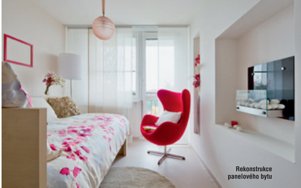
Rekonstrukce panelového bytu

XXXXXXXXXXXXXXXXXXXX XXXXXXXXXXXXXXXXXXXX