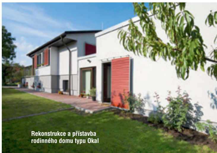
Rekonstrukce a přístavba rodinného domu typu Okal