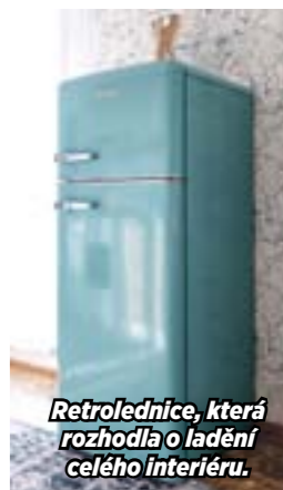
Retrolednice, která rozhodla o ladění celého interiéru.

„První díl z natáčené série je vždycky komfortní, ale teď mám před sebou díl, kde budeme mít na přípravu týden, maximálně dva, což je vzhledem k dodacím termínům hraniční. Samotná realizace pak trvá čtyři a půl dne. Díky Snu jsem si potvrdila, že pokud si projekt dobře naplánujete – některé profese na sebe navazují v půlhodinových intervalech – a obklopite se