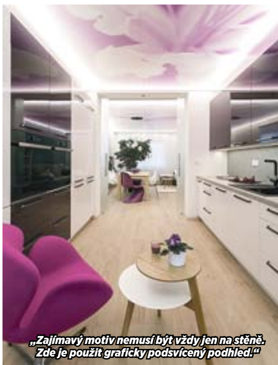
„Zajímavý motiv nemusí být vždy jen na stěně. Zde je použit graficky podsvícený pohled.“

„Kdybych přijímala zakázky v showroomu a řídila se jen rozměry, asi bych se opakovala. Ale pokud na sebe nechávám působit konkrétní lidi a daný prostor, není možné, aby mi vyšlo stejné řešení dvakrát. Možná si tím život zbytečně komplikuji, klienti by nepoznali, že už to někdo takhle