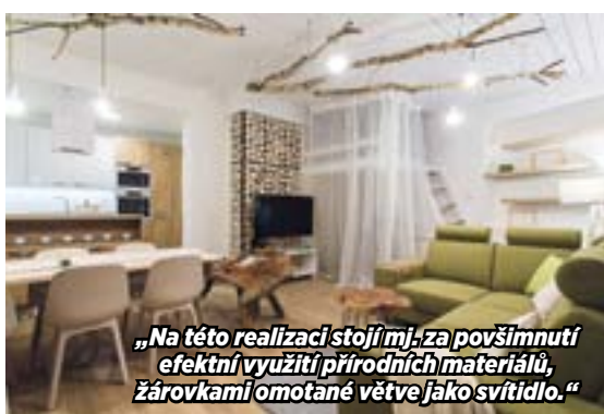
„Na této realizaci stojí mj. za povšimnutí efektní využití přírodních materiálů, žárovkami omotané větve jako svítidlo.“

doma má. Ale já si svou práci takhle usnadňovat nechci. Každý návrh je zkrátka originál.“